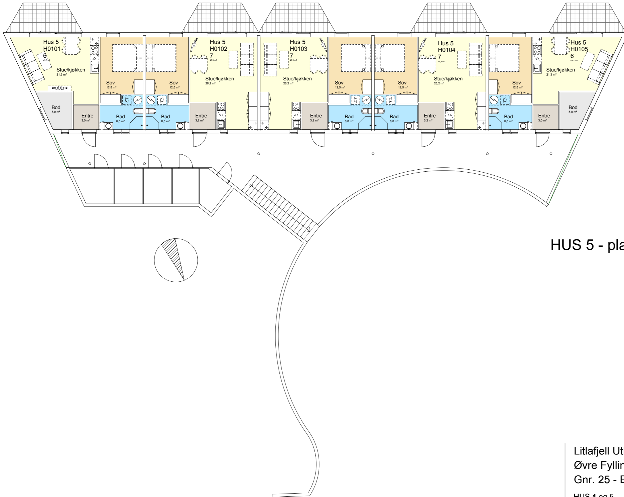
HUS 5 - plan 1

Litlafjell Utbygging AS Øvre Fyllingsdalen Gnr. 25 - Bnr. 13